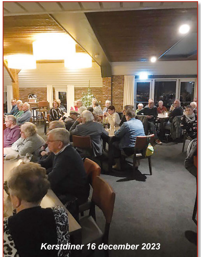
Kerstdiner 16 december 2023