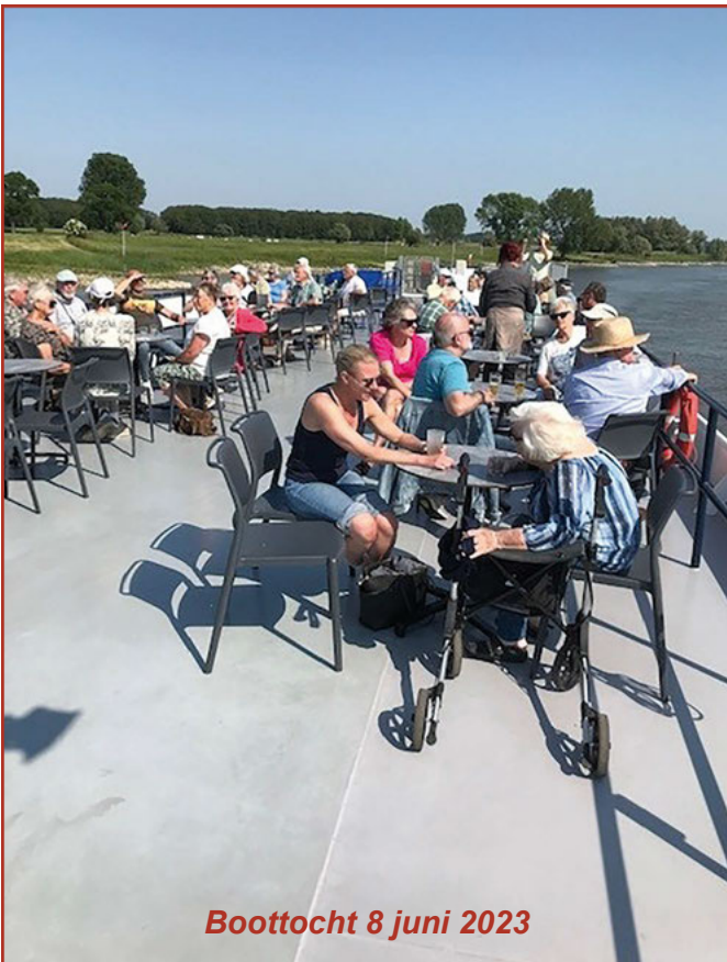
Boottocht 8 juni 2023