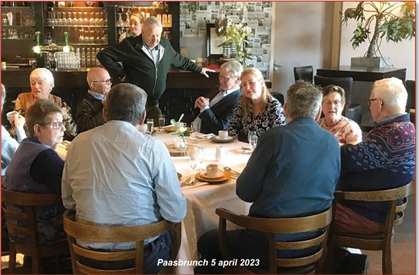
Paasbrunch 5 april 2023