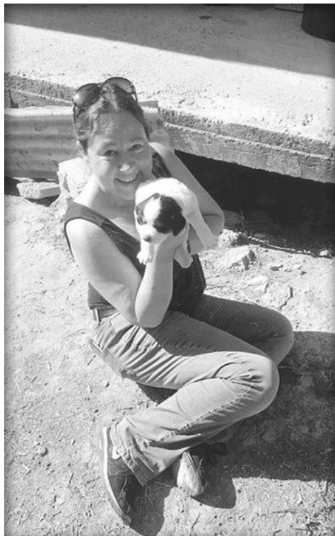
Gered uit het riool...