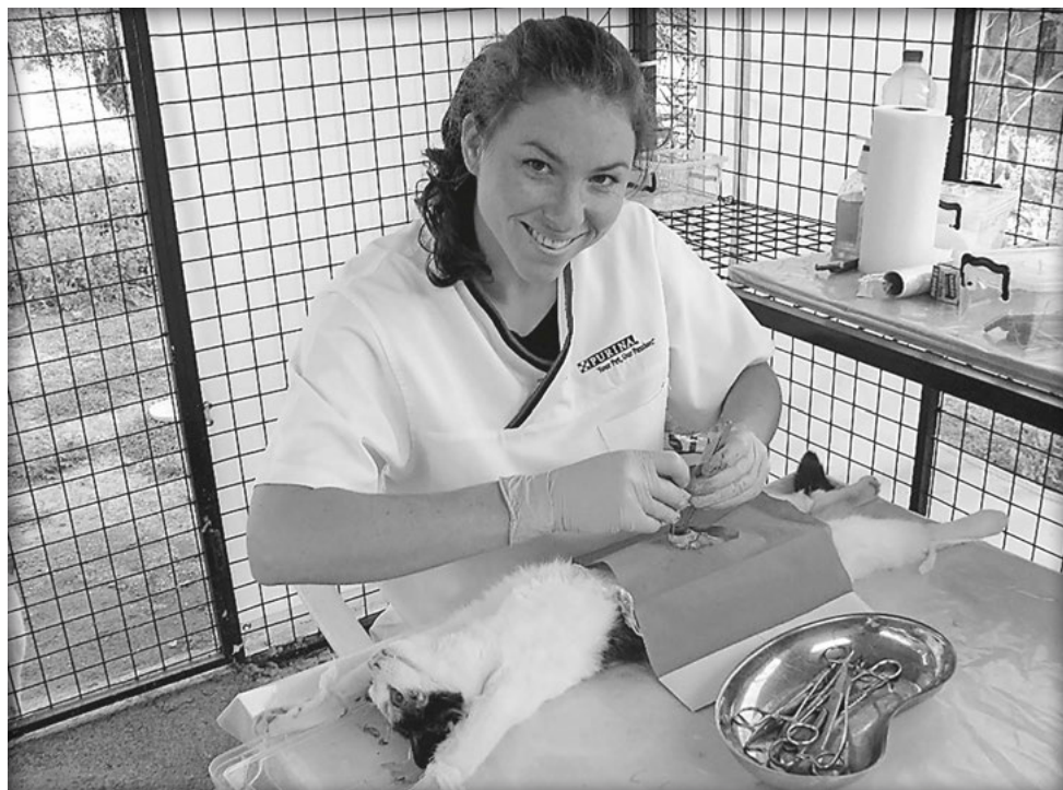
Sterilisatie van een kat in Turkije door een studente uit Utrecht.

Het echte probleem, namelijk dat er veel te veel zwerfdieren op deze wereld rondlopen wordt nog steeds te weinig aangepakt. Terwijl met een goede gerichte aanpak van structurele sterilisatieprojecten eindeloos veel ellende voor deze dieren kan worden voorkomen.