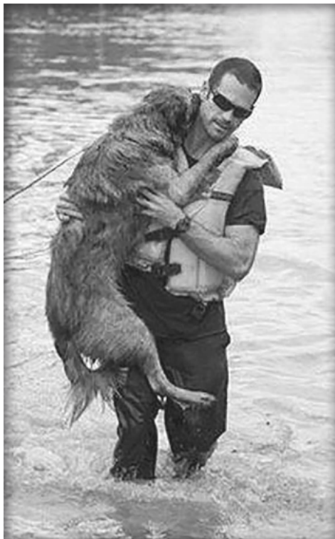
Wij helpen ook bij overstromingen.