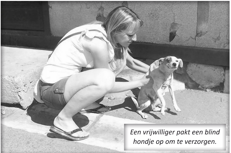
Een vrijwilliger pakt een blind hondje op om te verzorgen.

Samen zijn dat er al meer dan 300 geworden. Wij houden ook goed de resultaten in de gaten en die moet iedere hulpverlener met foto's en een goed verslag aan ons doorgeven, waarna wij ook dat op onze website www.dieren nood.nl laten zien.